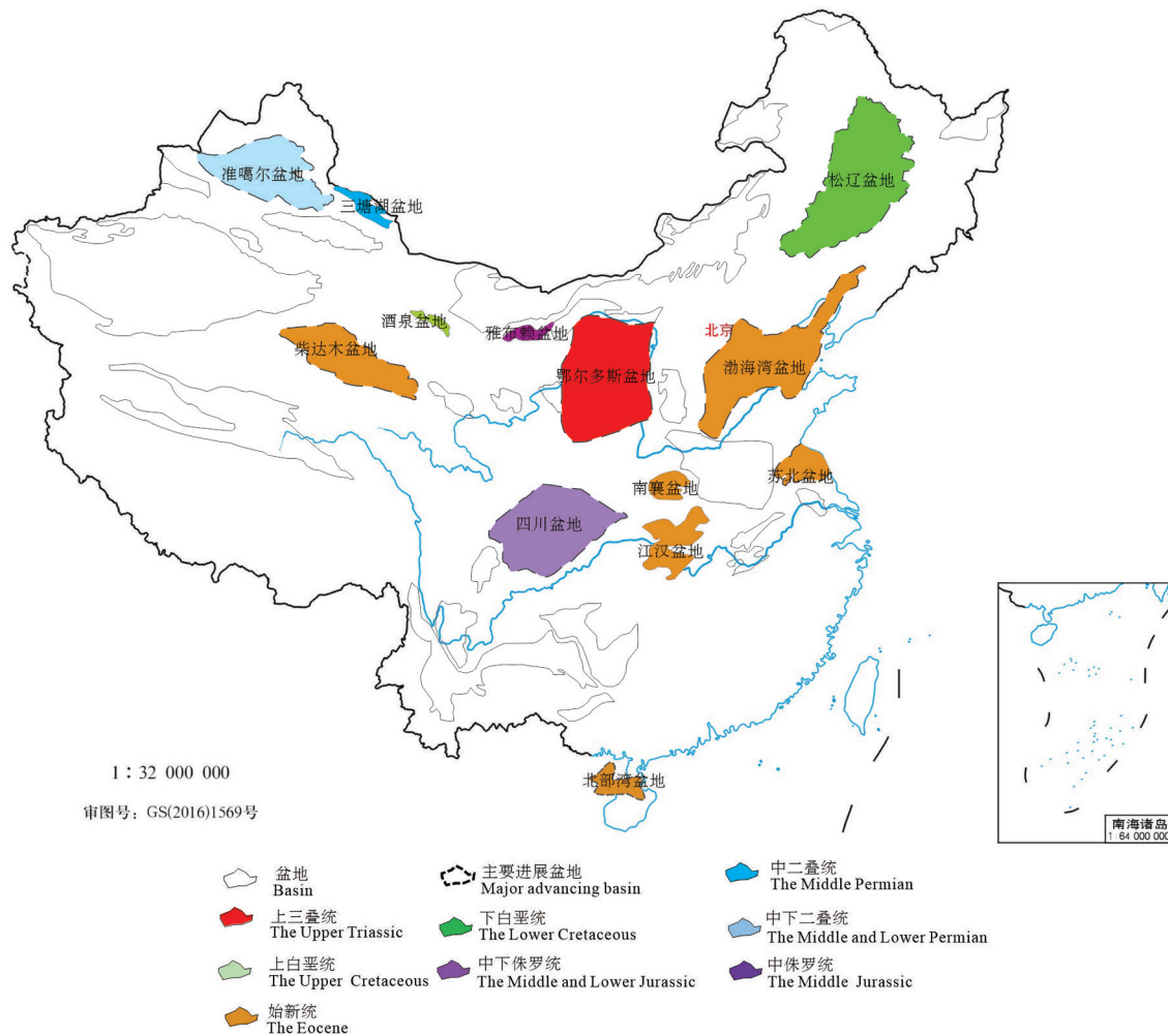
图2 中国陆相页岩油主要盆地和层系分布 Fig.2 Distribution of major basins and formations of continental shale oil in china

1井(张家强等,2021)、黄14H2井、岭页1井测试求产分别获日产121.38 t、138.21 t和116.8 t高产工业油流。2022年,新获工业油流井13口,预计新增探明储量8500万t。预计“十四五”末,庆城油田页岩油产能将超过500万t,产量超300万t。