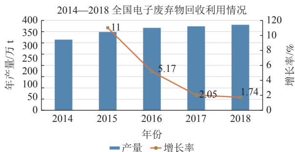
图 3 2014~2018 年全国电子废弃物回收利用情况 Fig.3 Recycling of electronic waste in China from 2014 to 2018.

三是我国电子废弃物回收产业发展滞后, 大量电子废弃物中含有的稀土元素没有得到有效回收利用。2014-2018 年中国再生资源行业发展报告指出: 2014 年至 2018 年, 我国电子废弃物产出量大幅提升, 但回收利用量却保持平稳, 增长率连年下降(图 3)。2019 年美国全年产出电子废弃物 691.8 万 t, 回收电子废弃物 500 万 t, 综合利用率在 72% 以上; 同期, 我国全年产出电子废弃物 1000 万 t, 仅回收 380 万 t, 综合回收率仅有 38%, 与美国相比差距明显。