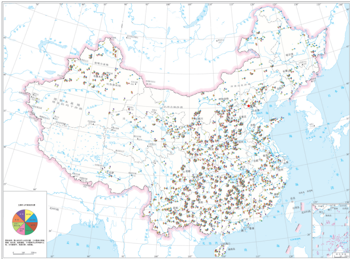
图4 中国主要矿山环境地质问题图 Fig.4 Mine geo-environmental problems in China

和可持续发展的重要基础性工作。面对“强化水污染防治、土壤污染管控和修复;实施重要生态系统保护和修复重大工程,强化湿地保护和恢复;加强地质灾害防治;建立以国家公园为主体的自然保护地体系”等迫切需求,我国环境地质工作面临新的挑战 and 机遇,必须朝着服务城市发展、统筹谋划水资源可持续利用和管理、加强地质灾害综合防治、服务和支撑生态地质环境管理、加强地球关键带相关问题研究等方向发展。基于以上考虑,未来我国环境地质研究的重点领域和工作方向主要包括以下方面: