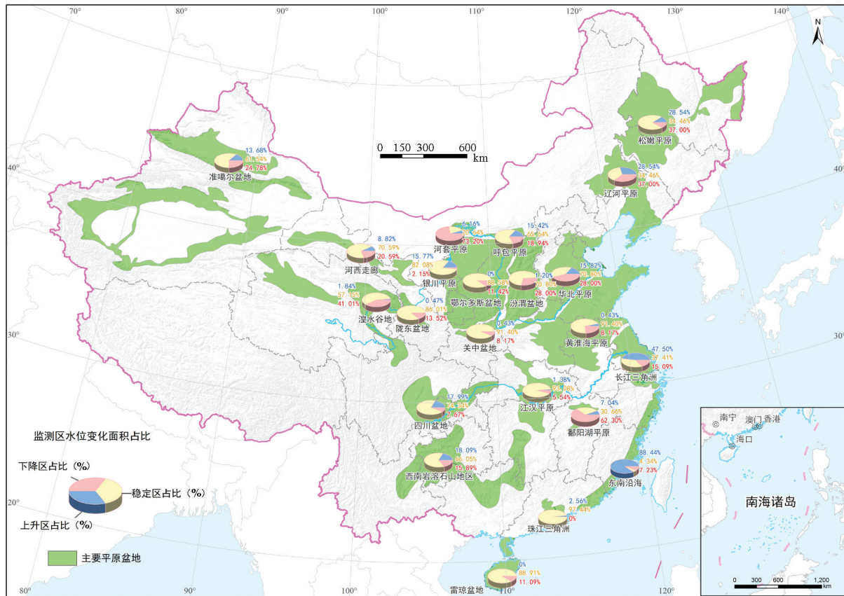
图1 中国主要平原盆地地下水水位动态特征图(数据截至2016年底) Fig.1 Dynamic characteristics of groundwater level in main basins of China (data up to 2016)

我国自20世纪80年代以来开展了两轮全国地下水资源评价工作,编制了中国地下水资源与环境图集,评价了全国地下水资源开发利用潜力以及地下水资源开发相关的环境地质问题,提出了地下水