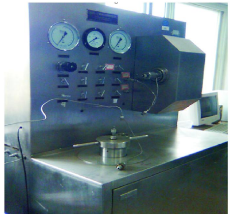
图 1 JHMD-II 型高温高压岩心动态损害评价系统

使用如图 1 所示的 JHMD-II 型高温高压岩心动态损害评价系统进行实验。实验中岩心夹持器上分别设立 4 个测压点,将岩心分成 4 段,分别测试各段的压差,进而计算各段的渗透率(如图 2 所示)。