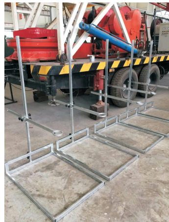
图 2 专用拍照支架

为了保证岩心拍摄角度和距离的一致性,现场施工人员与加工厂家共同设计了拍摄专用支架(见图 2),该架子下部为 4 根不锈钢方管焊接的水平平台,长 100 cm、宽 60 cm,可将岩心放置于此平台,保证岩心的水平。平台一端固定垂直于平台的方管,方管高 1.5 m,管上连接可上下移动的滑块,滑块一段焊接水平导轨,导轨上装相机固定螺丝。使用时将单反相机连接于水平导轨之上,镜头朝下正对岩心,通过上下、左右调节滑块以及相机位置,可以保证对岩心拍摄角度与距离的一致性,图 3 为岩心拍摄现场,图 4 为现场岩心照片,由于保证了对每组岩心拍摄的一致性,为后期处理照片奠定了良好的基础,更为第四系地层的对比和划分提供了有力保证。