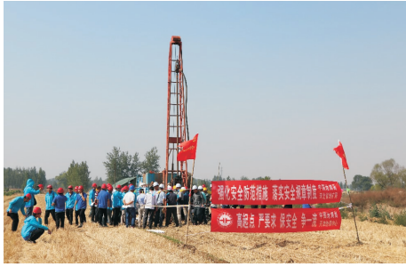
图 1 雄安新区工程地质勘察大会战现场