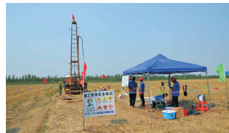
图 3 岩心拍摄现场